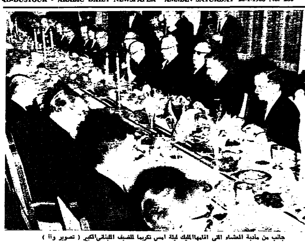
جانب من مائدة العشاء التي اقامها الملك ابي بكر في قصر الحسينية

مطالب اسرائيل من حارات ايلات اصحفت لارضية زعماء اجراء انتقامية الطبعة المحتلة - (خاص بالدستور) - اصحفت الصفحة الاسرائيلية بنصف لأمر حادث اطلاق حركات القبط في ايلات من قبل الفلسطينيين العرب في لطاق الاحتلال . وقد تمسك هذا القسب البيعة على صفحة ٣ عمود ٢